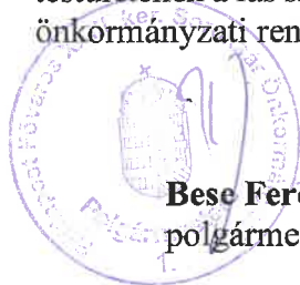
Bese Ferenc polgármester

23. § Hatályát veszti Budapest Főváros XXIII. kerület Soroksár Önkormányzata Képviselő-testületének a fás szárú növények védelméről, kivágásáról és pótlásáról szóló 11/2018. (III. 23.) önkormányzati rendelete.