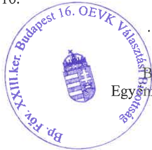
Takaró Mihály Károly

Budapest 16. számú Országgyűlési Egyéni Választókerületi Választási Bizottság elnöke