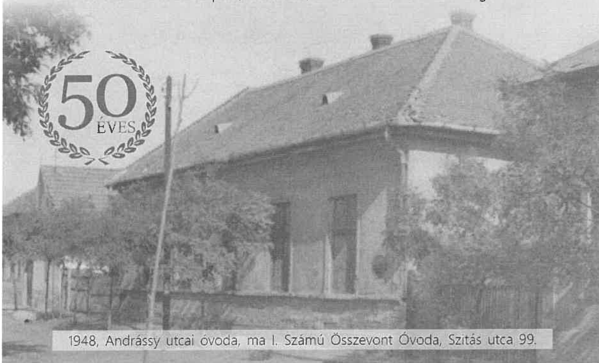
1948, Andrassy utcai óvoda, ma I. Számú Összevont Óvoda, Szitás utca 99.

Galéria '13 • 1238 Budapest, Soroksár, Hősök tere 13. • www.galeria13.hu