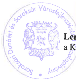
Lengyel Zsuzsánna a Kuratórium elnöke előterjesztő